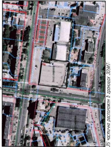
35. Частичка расположена в границах ЗОЭИТ