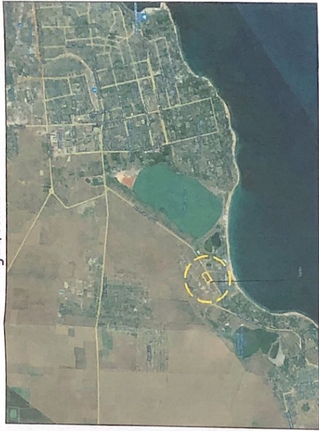
Месторасположение земельного участка