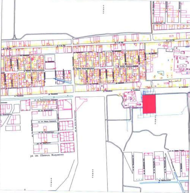
СХЕМА РАСПОЛОЖЕНИЯ ЗЕМЕЛЬНОГО УЧАСТКА В ОКРУЖЕНИИ СМЕЖНО РАСПОЛОЖЕННЫХ ЗЕМЕЛЬНЫХ УЧАСТКОВ