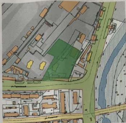
1. Чертеж градостроительного плана земельного участка