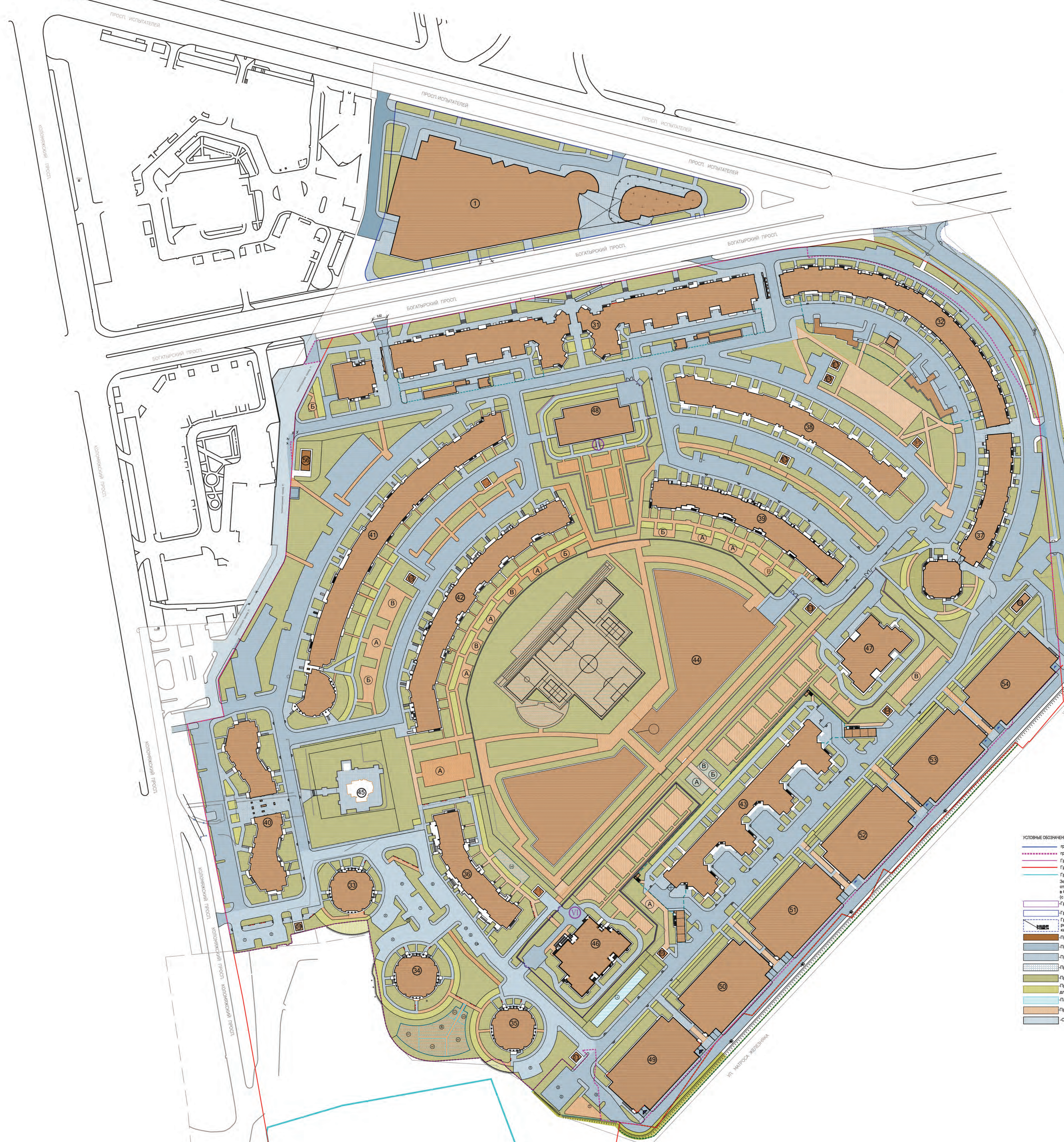
СХЕМА ПЛАНИРОВОЧНОЙ ОРГАНИЗАЦИИ ЗЕМЕЛЬНОГО УЧАСТКА КВАРТАЛЬНОЙ ЗАСТРОЙКИ ЖК "ПРИМОРСКИЙ КВАРТАЛ" Санкт -Петербург, Коломяжский пр., д.13, литер А, кадастровый номер 78:34:0410401:3609.