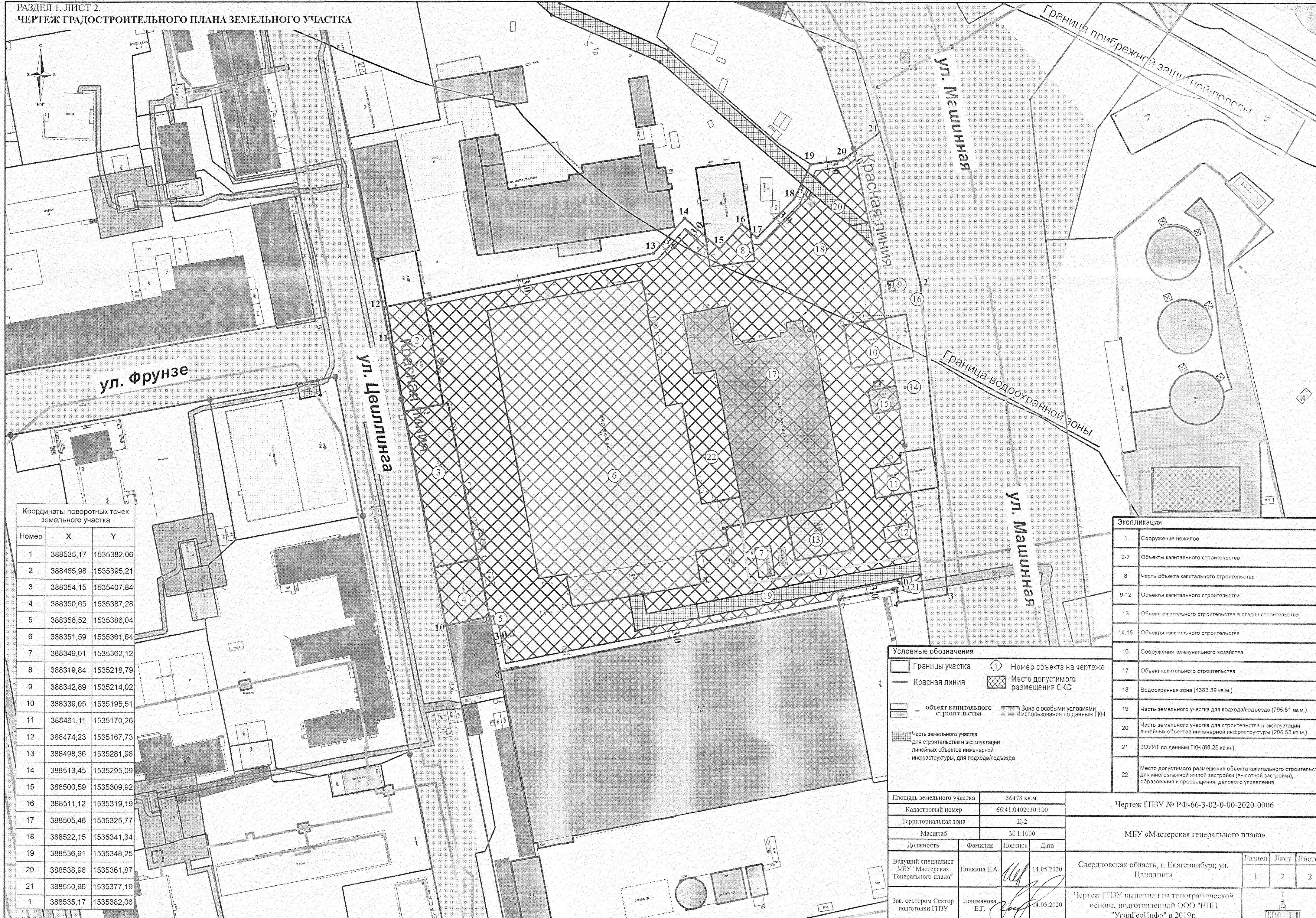
Координаты поворотных точек земельного участка