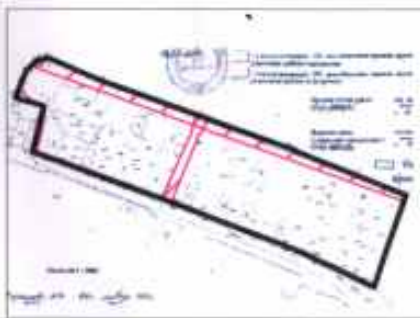
Ситуационный план М 1:5000