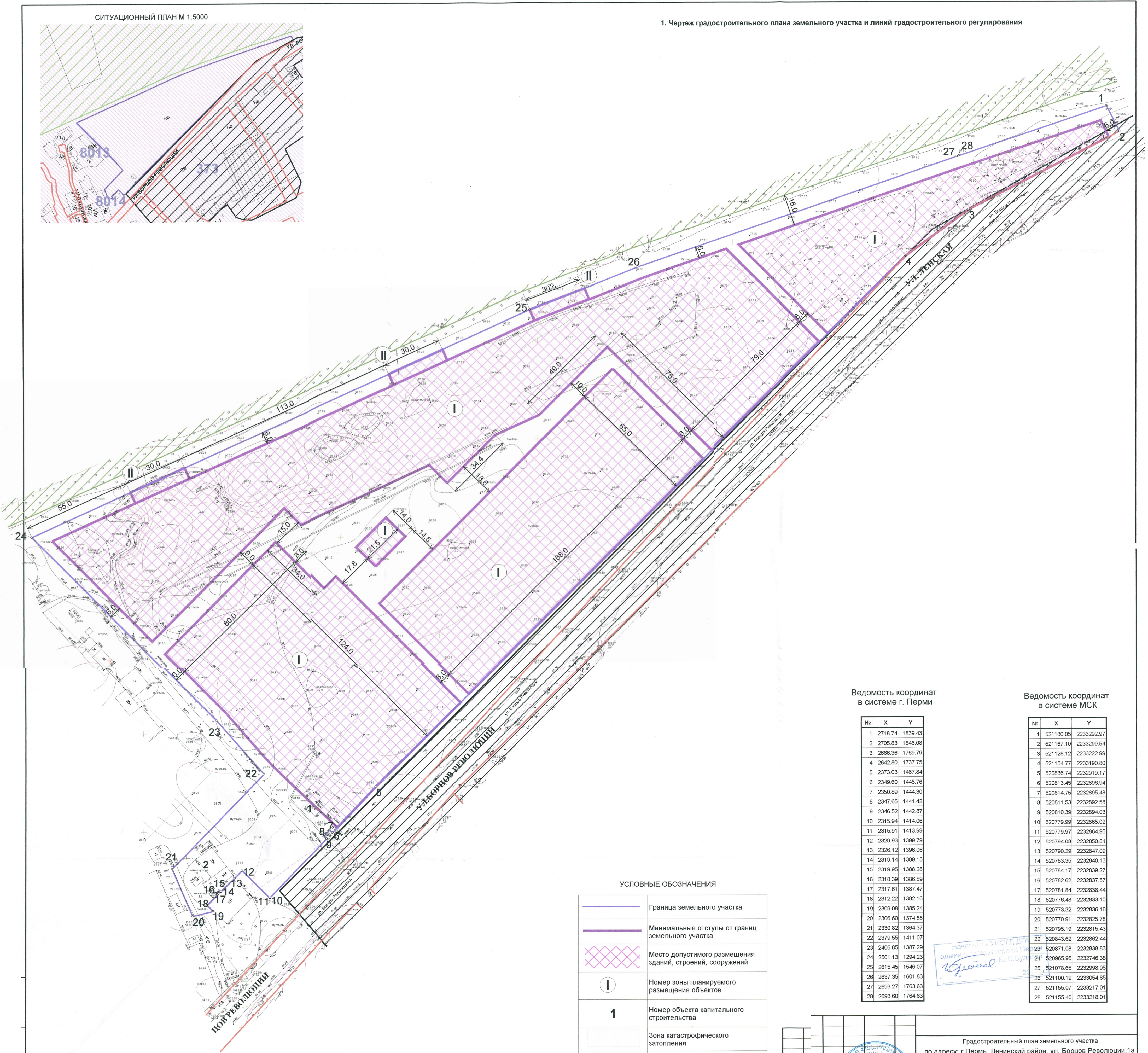
Ведомость координат в системе г. Перми