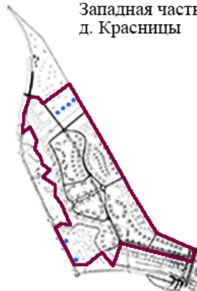
Рисунок 1 - Территория сельского поселения, охваченная централизованной системой водоснабжения