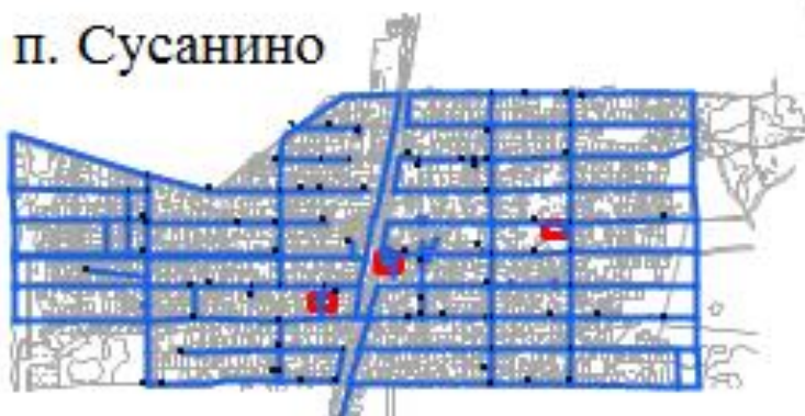
Рисунок 15 - Схема размещения объектов централизованного водоснабжения