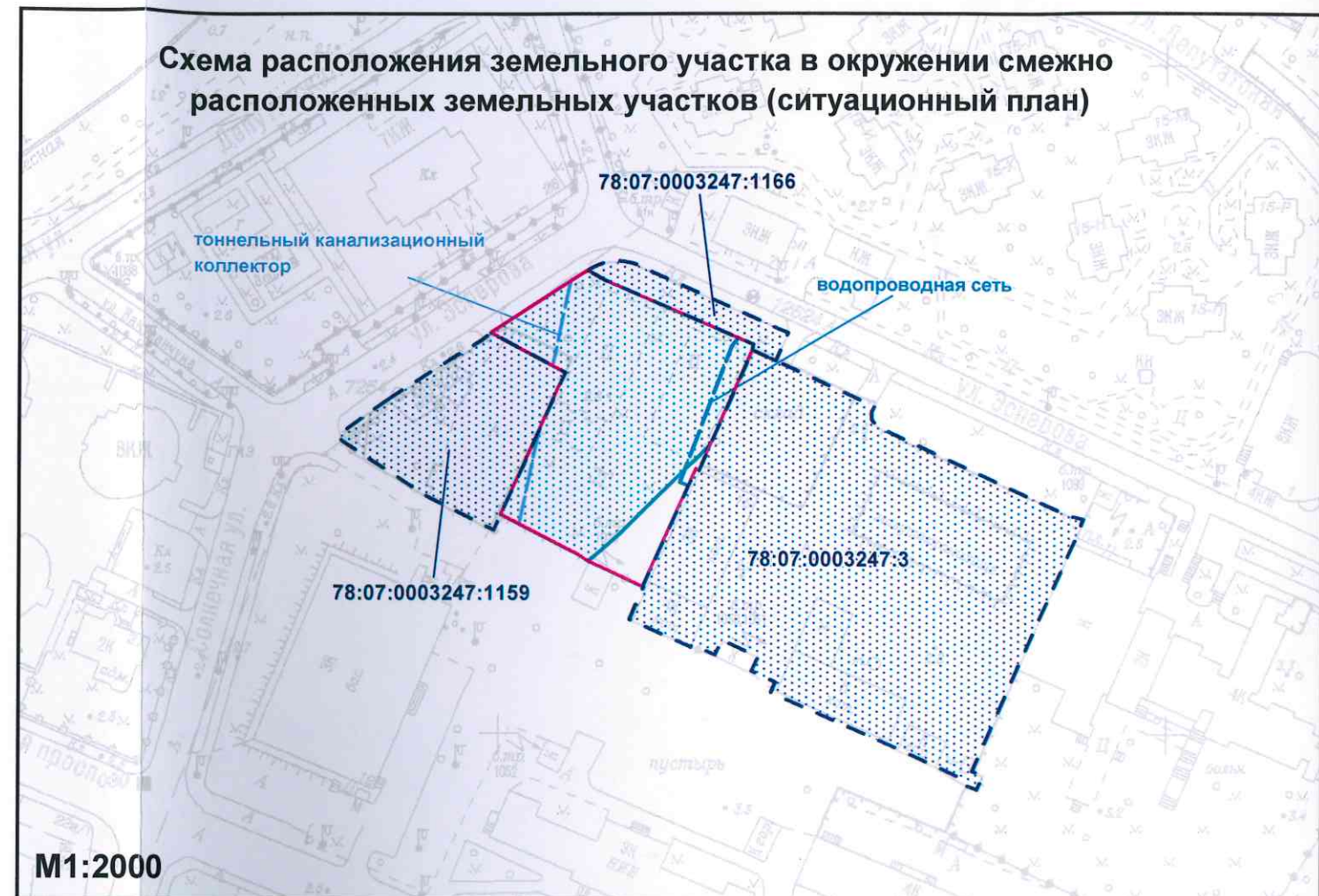
Схема расположения земельного участка в окружении смежно расположенных земельных участков (ситуационный план)

- смежные земельные участки, прошедшие государственный кадастровый учет