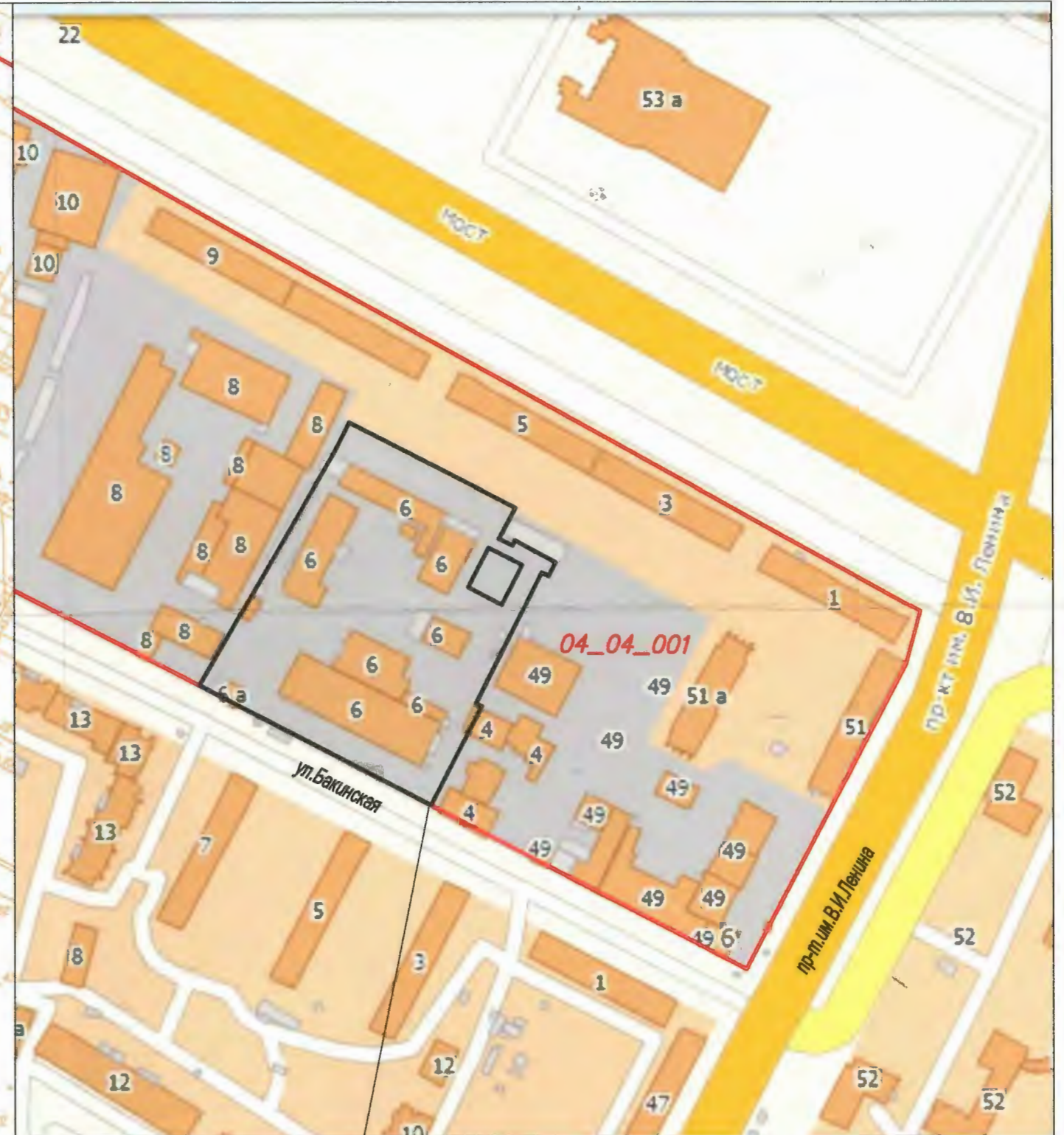
положение земельного участка