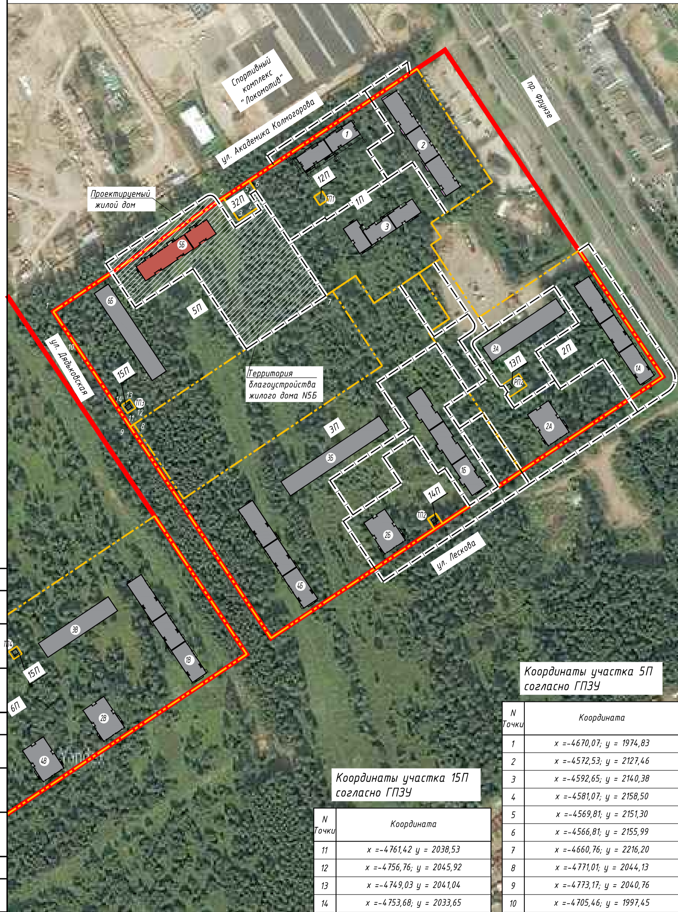
Координаты участка 5П согласно ГПЗУ