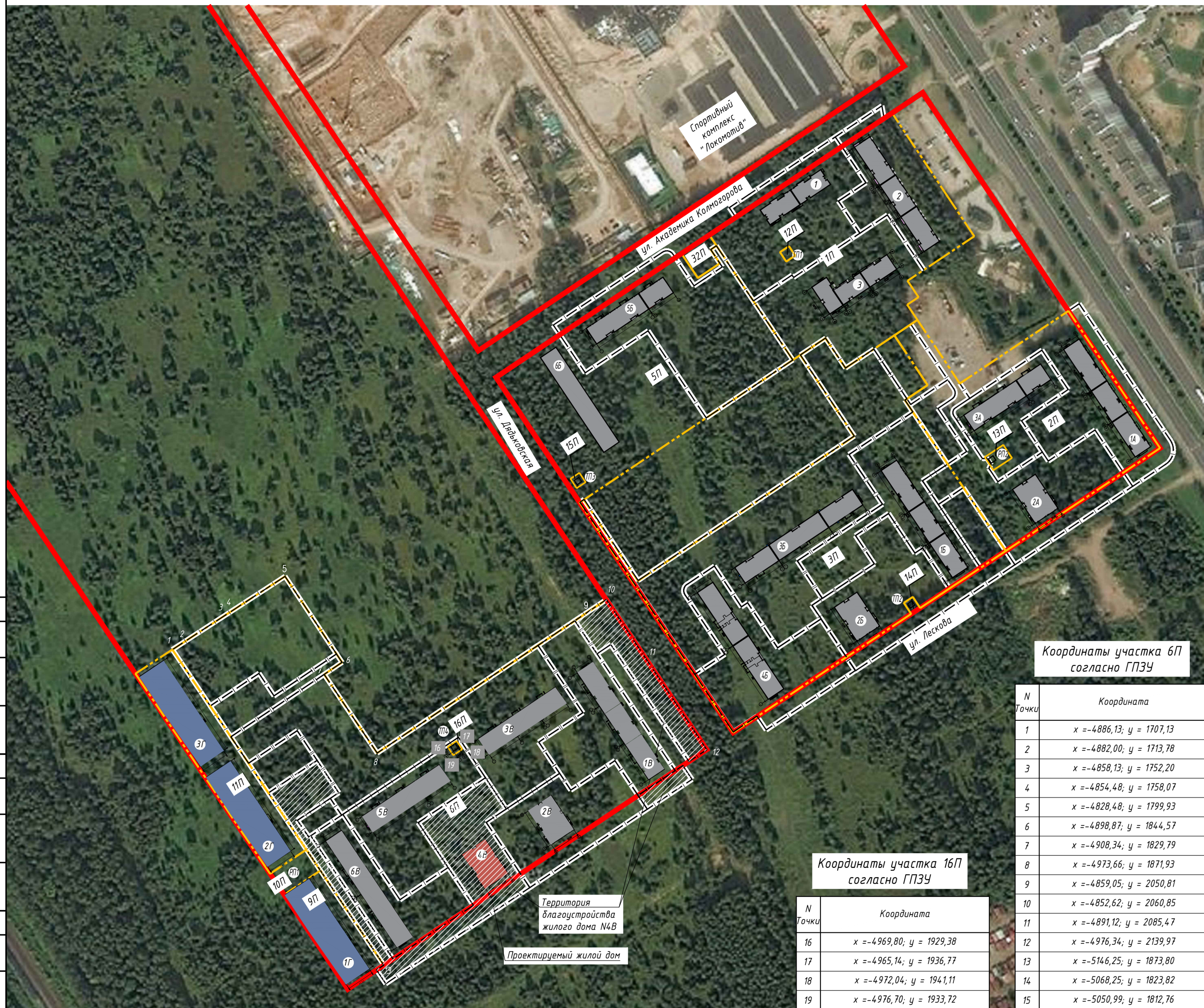
Координаты участка 6П согласно ГПЗУ